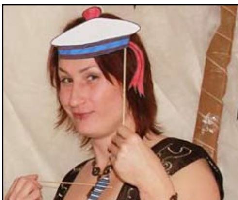
Nová kulturní i divadelní posila Zichy