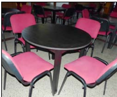
Nové kulaté stoly i na divadlo