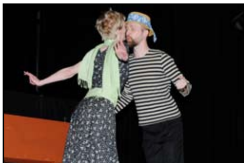
2. místo - Divadlo DiGoknu Rožnov pod Radhoštěm - Řeknu ti to v říjnu