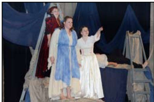
3. místo - Divadelní spolek Kroměříž - Slaměná židle